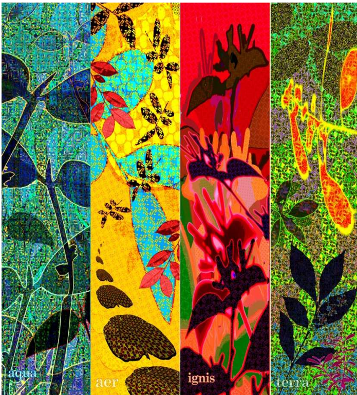
Xavier Cortada - Four Elements at the Frost