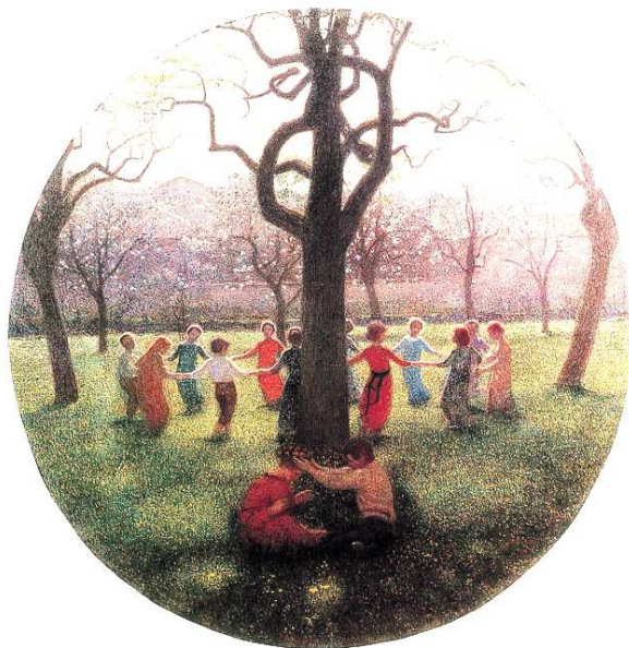
Pellizza da Volpedo - Idillio primaverile (1896-1901)

La vita va vissuta con pienezza. È necessario avere sempre la forza e l'energia per superare gli ostacoli che incontriamo. Dobbiamo essere anche aperti al mondo con sensibilità e leggerezza per fluire nell'umanità, anche per comprendere noi stessi.